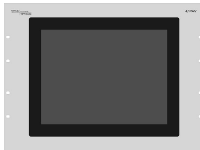
TP150E Touch Panel